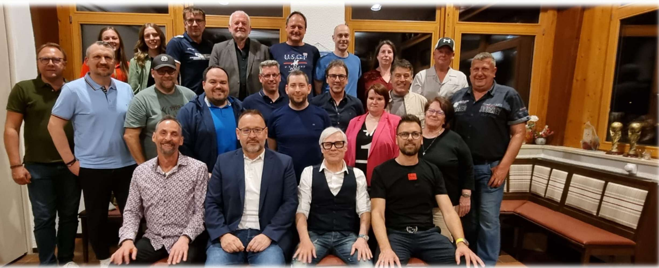
Die Vorstandschaft des FSV VfB Straubing 2024/2025